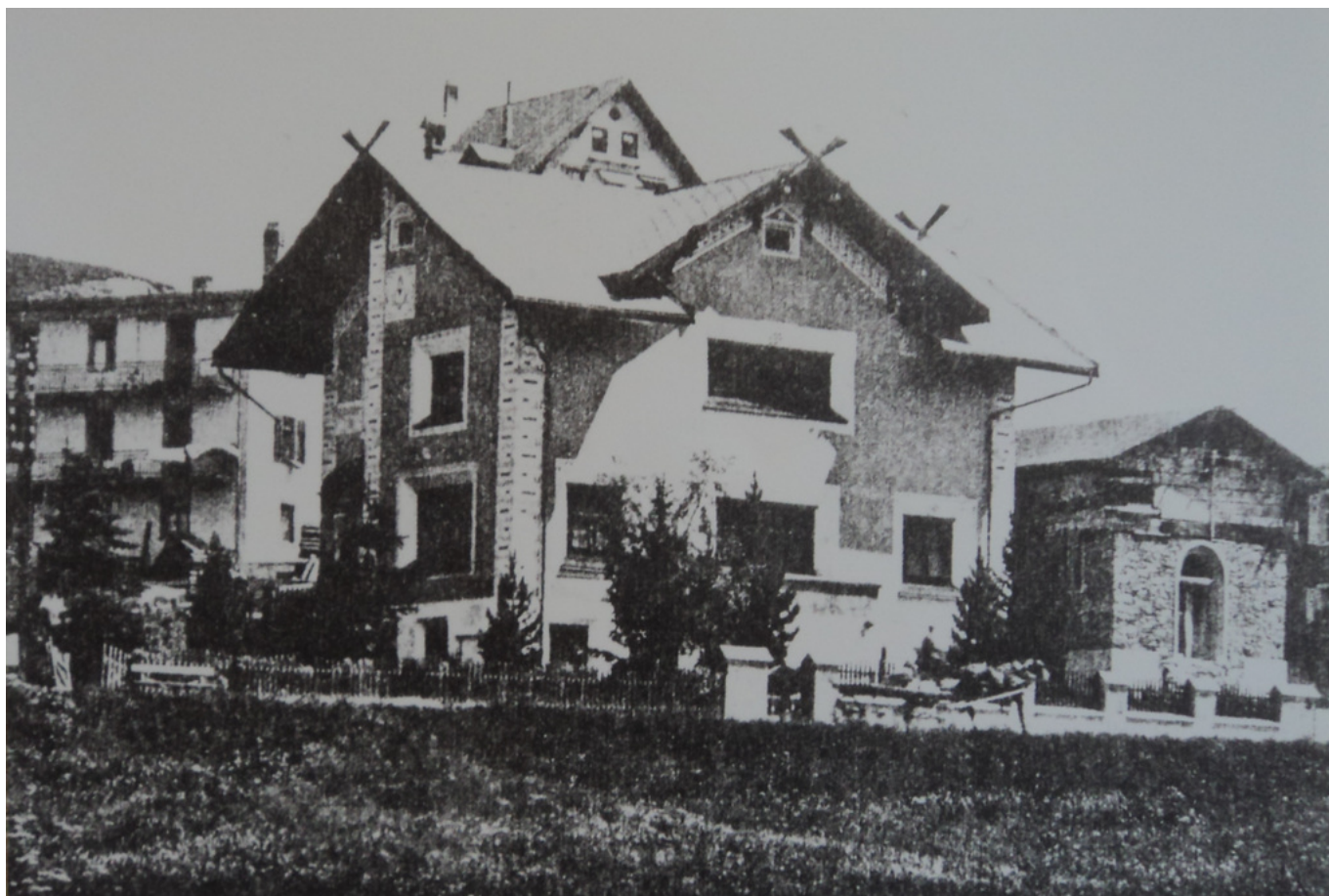
Здания на Скалетташтрассе около 1925 г. Слева - масонская ложа, справа - недостроенный православный храм.

Примечательно, что купившее участок частное лицо храм не разбирало: готовые стены были использованы для построенной вместо него виллы. Дом лишь расширили в сторону Скалетташтрассе. Со стороны этой улицы, по которой здание по-прежнему числится под номером 9, ничто не выдает необычную историю постройки. Вилла как вилла, несколько, правда, бесформенная, с точки зрения автора. Принадлежит врачу, уважаемому в городе человеку. Рядом вплотную – построенный чуть раньше, в 1907 году, дом «Хуманитас», который, кстати, обретал и даже, кажется, до сих пор обретает давосскую масонскую ложу. Но не будем беспокоить соседей, обойдем ложу, выйдем на параллельную, «заднюю» улицу – Россвайдштрассе, и обнаружим неожиданное! Сада тут нет, к дому можно подойти почти вплотную. И с этой стороны виллы до сих пор явно просматривается округлость алтарной абсиды!