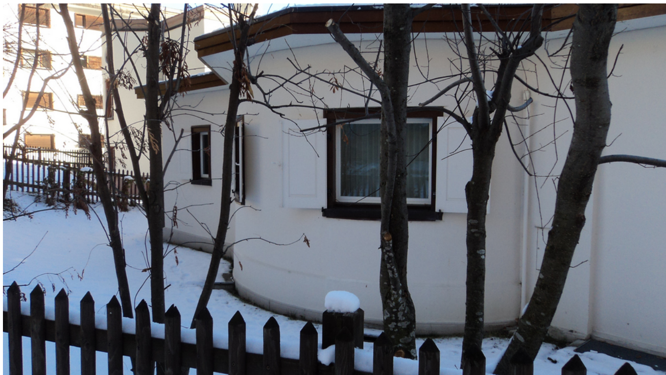
Бывшее храмовое здание со стороны Росвайдштрассе. Отчетливо видна алтарная абсида.