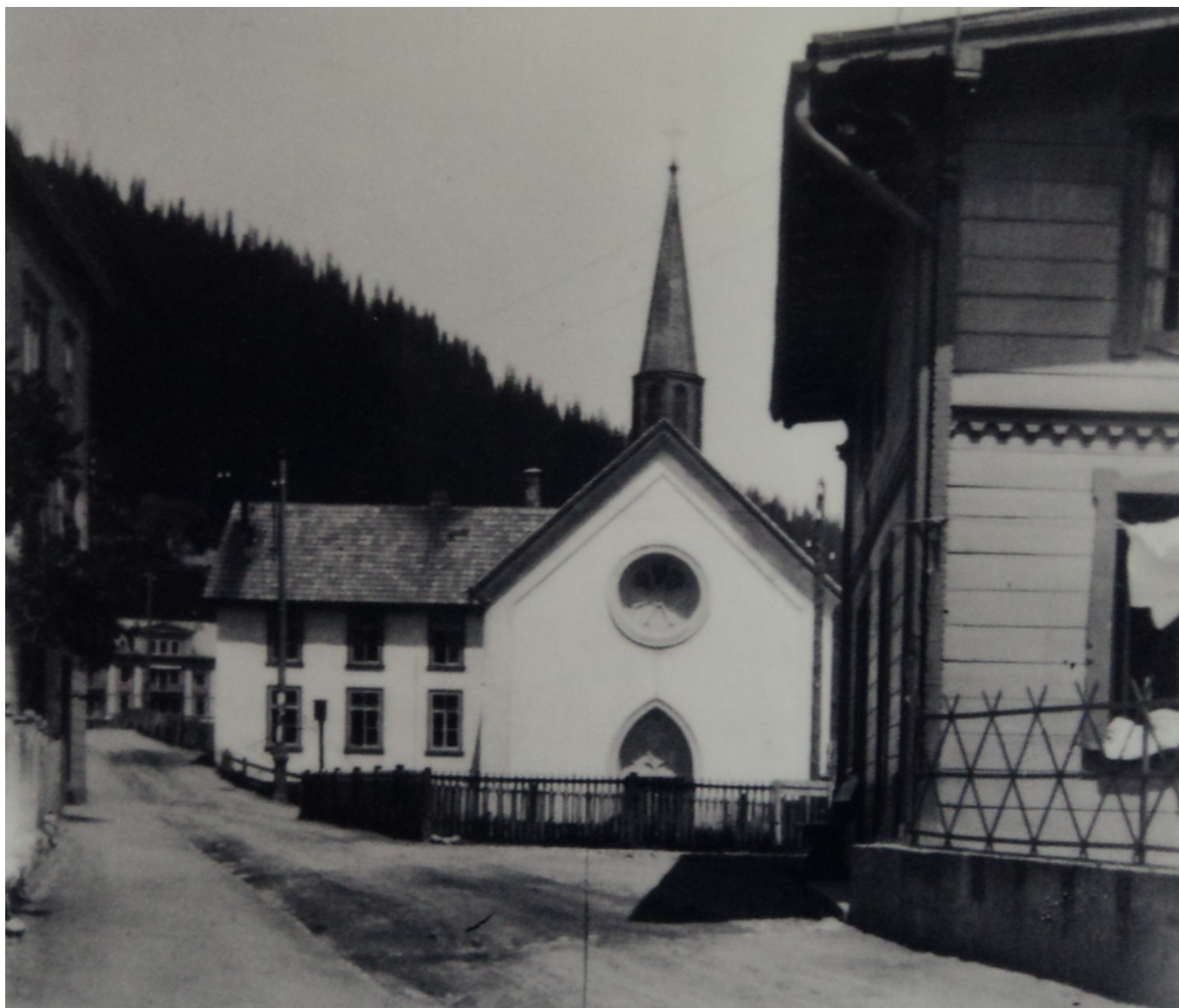
Римо-католический храм на Обере Штрассе 18, где в 1909-1914 гг. проводились православные богослужения. 1896 г.