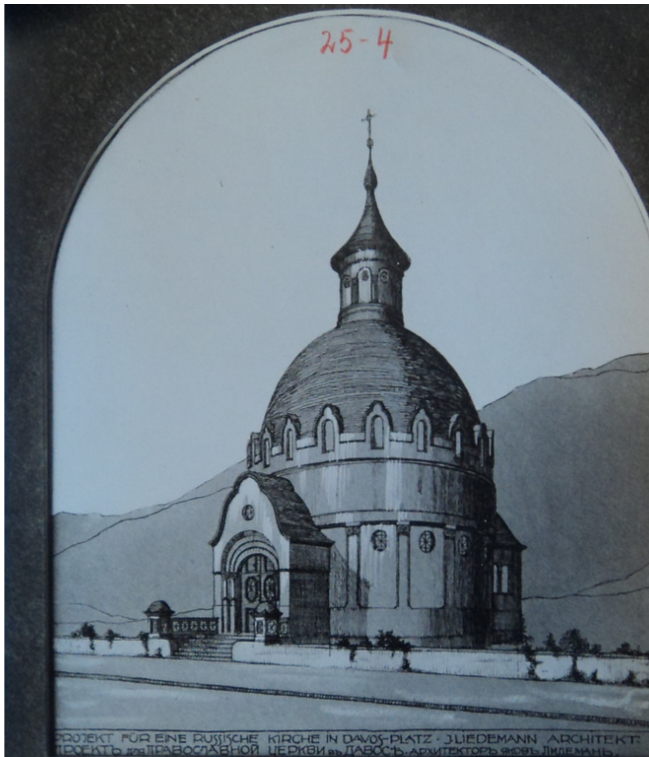
Эскиз Православной церкви в Давосе. Вариант В.