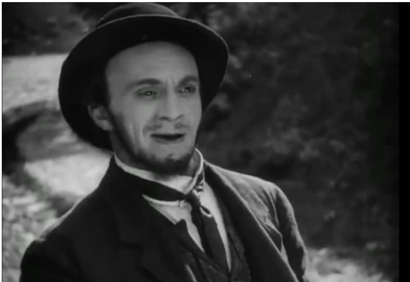
Соломон Михоэлс в роли Менахема Мендла

Author: Надежда Сикорская, Женева , 06.11.2015.