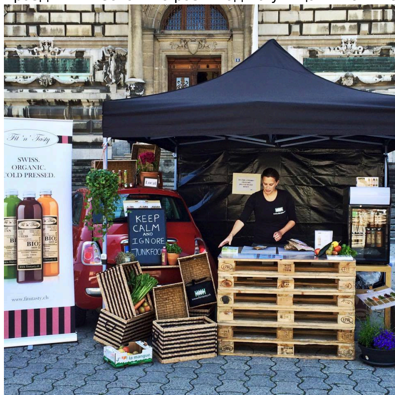
Здоровая пища – здоровое тело

Первые мероприятия такого рода прошли несколько лет назад в Лондоне, затем в Париже, Риме, Берлине, Лозанне и Цюрихе. Сегодня «стрит-повара» устраивают праздники несколько раз в год на улицах многих столиц мира.