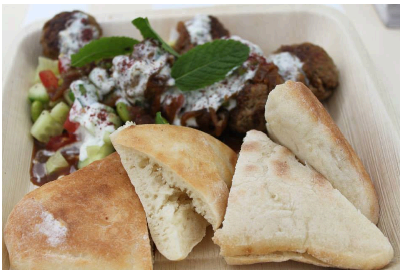
Не «фаст-фудные» блюда (facebook.com)

При этом не следует путать уличную еду с фаст-фудом, определения того и другого дает Продовольственная и сельскохозяйственная организация ООН. Блюда и напитки из первой категории нередко отражают особенности местной кухни и отличаются большим разнообразием. Ларьки с такой едой часто находятся на улице и могут предложить клиентам простые стулья, если те желают съесть блюда на месте. Успех мини-предприятий построен исключительно на их удобном месторасположении и рекламе «из уст в уста». Чаще всего это – семейный бизнес, который, тем не менее, приносит пользу местной экономике, так как продавцы готовой пищи покупают продукты у знакомых фермеров.