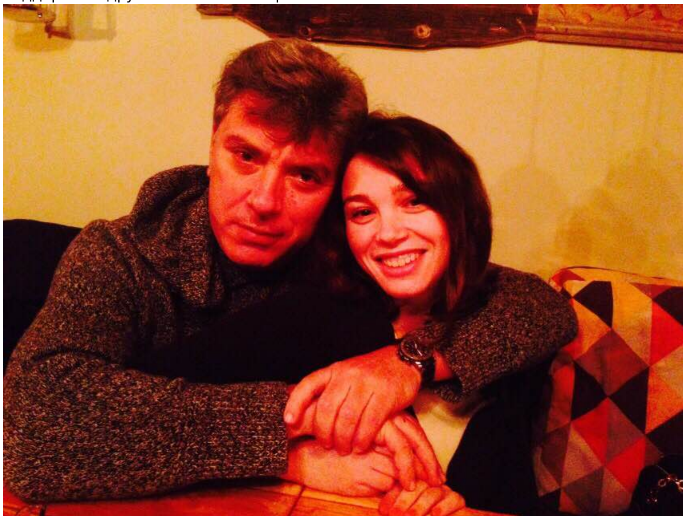
С папой (из личного архива Жанны Немцовой)

Вы абсолютно правы. Это вечер памяти, а не коммерческий проект. Артисты выступают на благотворительной основе, но есть организационные расходы, и они немаленькие. Инициатором являюсь я, и сама внесла в том числе и финансовый вклад. Часть расходов, я очень надеюсь, будет покрыта за счет билетов. Меня поддержали друзья папы и сами артисты.