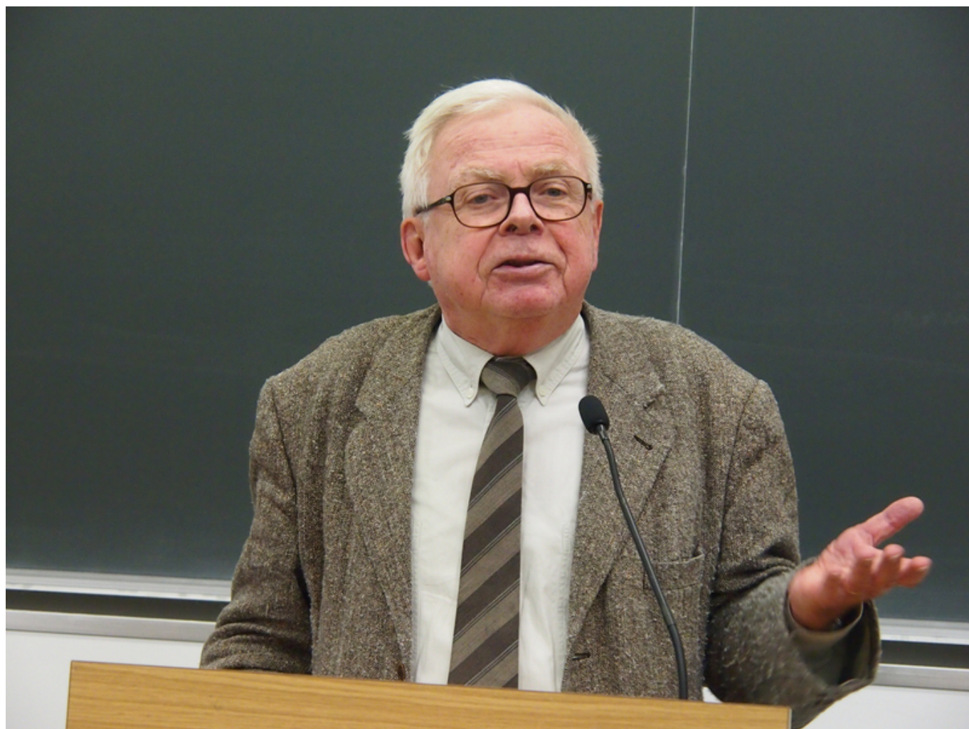
Мишель Окутюрье о Льве Толстом (Nashagazeta.ch)

Когда в конце 19 – начале 20 века накатились две волны русского романа, Толстого и Достоевского, и о русском романе начали говорить, как об особом жанре, этот вопрос был поставлен французской критикой. Спорили о духовности русского романа, противопоставляя ее «социальности» романа французского. Русская литература взяла «бытийные» вопросы и вывела их на первый план. Остальные стороны русского романа – его объемность, эпичность, грандиозность тем – все это, конечно, оставило след.