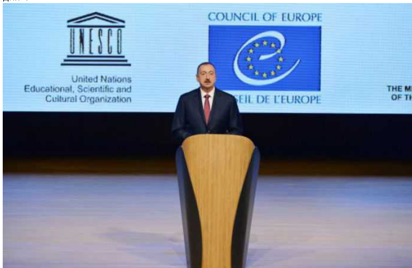
Президент Азербайджана Ильхам Алиев на открытии Третьего Всемирного форума по межкультурному диалогу

Открывая Форум – без бумажки и на отличном английском языке – президент Азербайджана Ильхам Алиев подчеркнул, обращаясь к более 500 участникам из почти ста стран, что в Азербайджане представители всех религий и этнических групп вносят свой вклад в его успешное развитие. «Думаю, это одно из главных наших богатств. К сожалению, то, что происходит сегодня в разных частях света, вызывает большую озабоченность. Мы наблюдаем негативную тенденцию. Разрядка напряженности и враждебности – одна из главных задач на международной повестке дня».