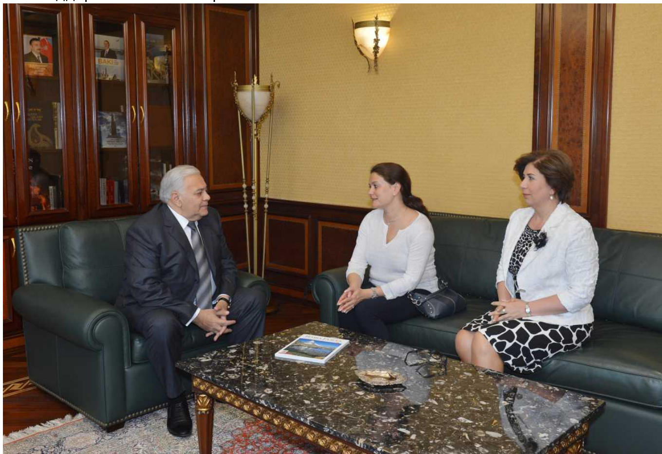
Редактора Нашей Газеты.ch приняли председатель парламента Азербайджана Октай Асадов и его заместитель Бахар Мурадова