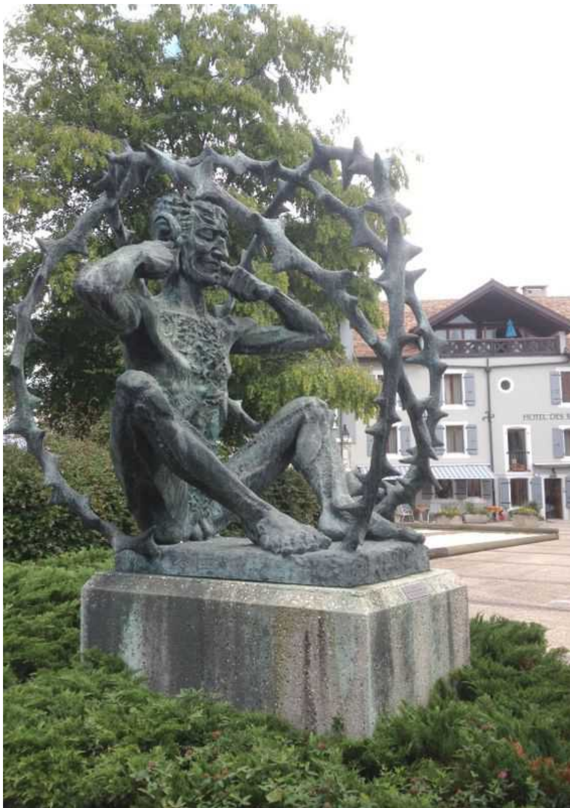
Долой шум!