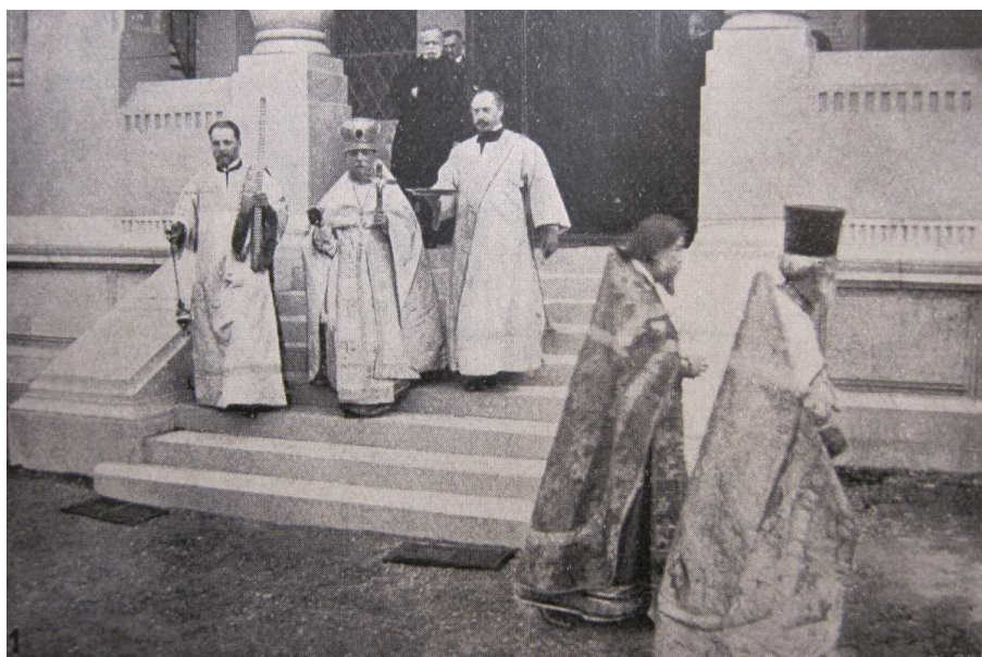
Освящение храма и колокольни в Женеве, февраль 1917 г. La Patrie suisse. №613,