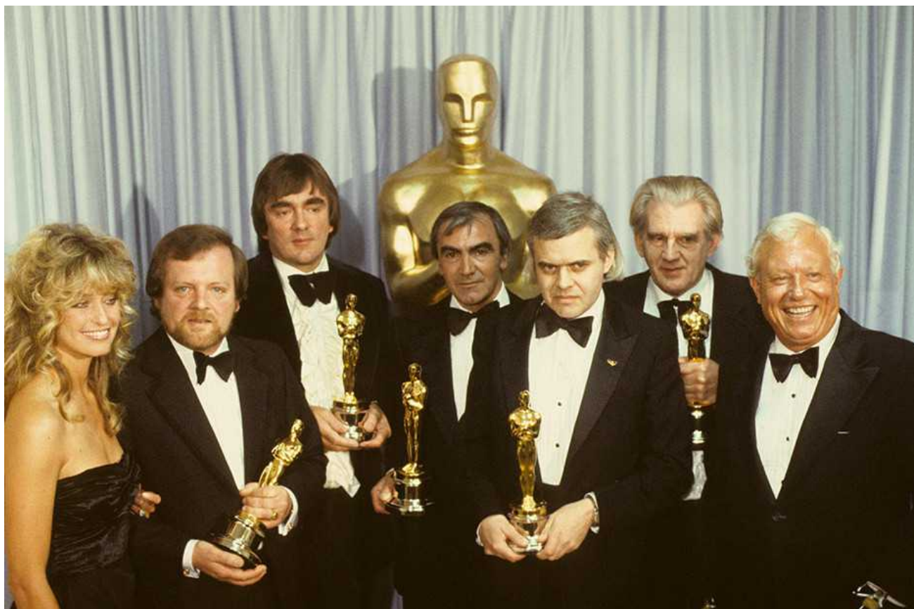
На вручении Оскара швейцарская культура