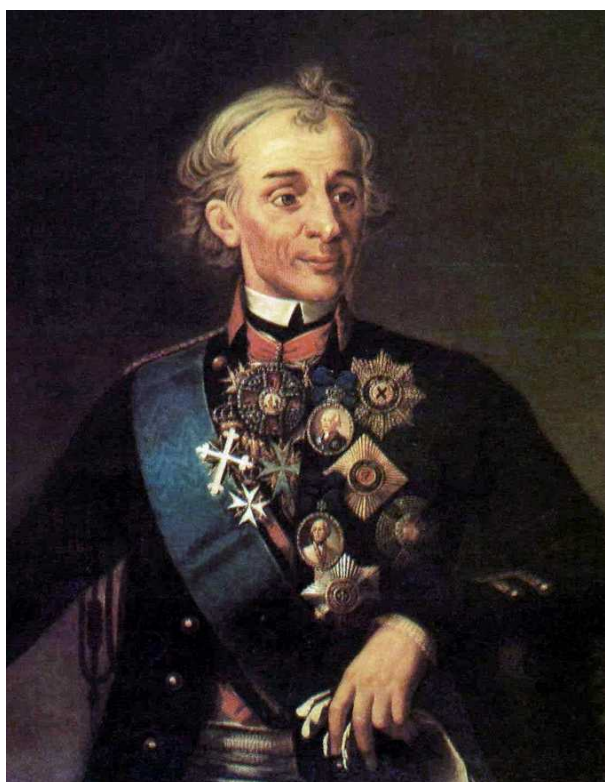
Портрет Суворова кисти Джорджа Доу

Напомним кратко исторический контекст. К концу августа 1799 года в Швейцарии оставался 24-тысячный русский корпус под командованием Александра Римского-Корсакова. Союзные России австрийские войска начали покидать Швейцарию, оставляя 84-тысячной французской армии под командованием Массена возможность без труда справиться с русскими. Поражение отечественной армии означало бы полный торжество французов в Швейцарии, лишая ее надежд на независимость.