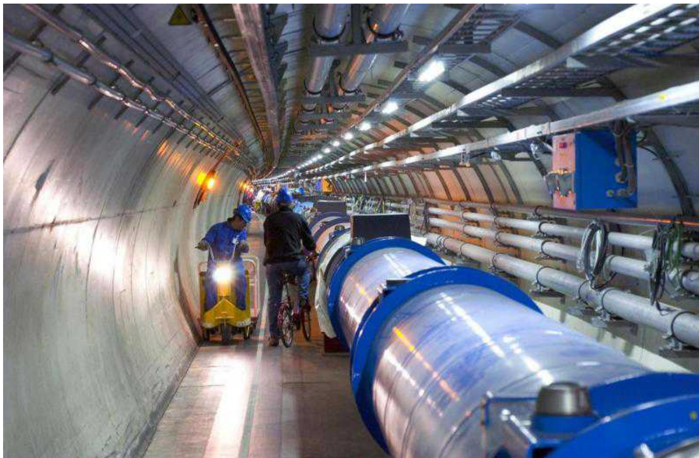
Прогулки по БАКу © CERN

Author: Татьяна Гирко, Женева , 13.09.2013.