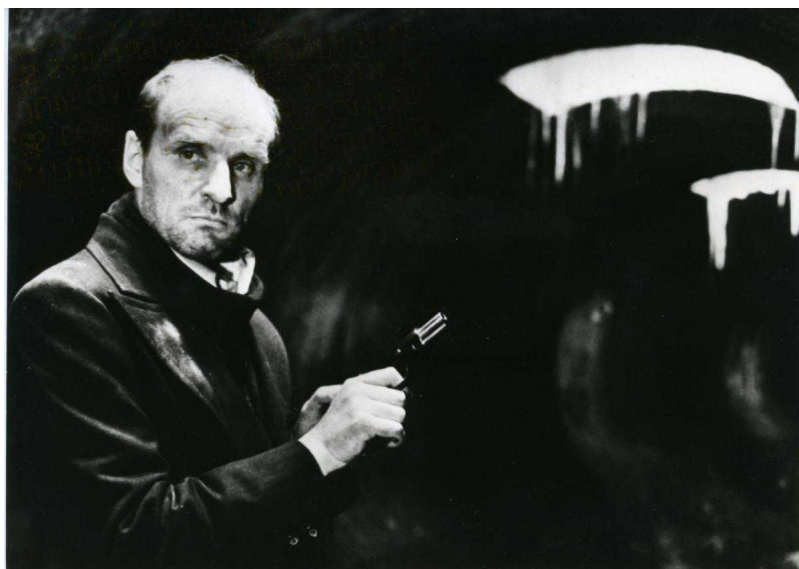
Анатолий Солоницын

Своей мировой славой литературные персонажи братьев Стругацких обязаны Андрею Тарковскому, который в 1979 году превратил историю о Сталкере в шедевр кино. Конечно, фильм очень отличается от повести (недаром Стругацкие шесть раз (!) переписывали сценарий), это – самостоятельное творение на тему, заданную писателями-фантастами.