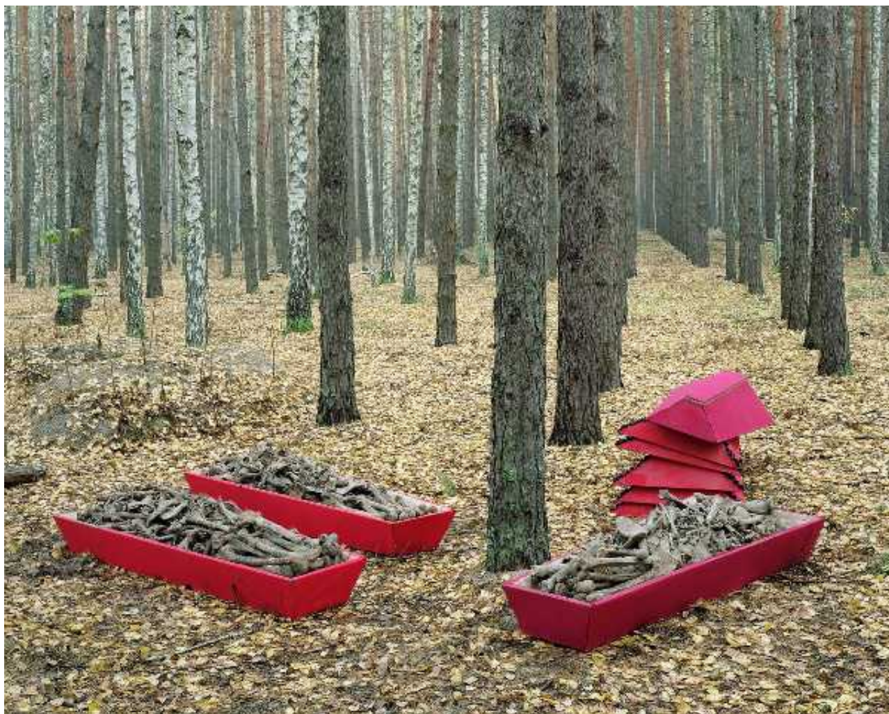
Человеческие останки, извлеченные из братских могил в деревне Дубовка, близ Воронежа

Но утверждать это, как и резко отрицать, одинакового неверно. В этой книге, полной переворачивающих душу фотографий и свидетельств (детей жертв, арестованных однажды и исчезнувших без следа), русская историография продолжает извиняться за собственное существование. Она предаёт некий идеал. Подрывает некий патриотизм. Время ослепляющей правды, а следовательно, и успокоительного умиротворения кажется ещё очень далеким, когда листаешь эту книгу, несмотря на критику, замечательную.