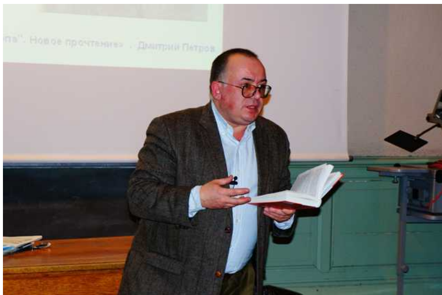
Дмитрий Петров об Аксенове

ем, кто помог мне с книгами. Хотя поначалу иные отнеслись к этой затее без энтузиазма. При нашей первой встрече давний друг Аксенова писатель Кабаков Александр Абрамович обдал меня легким холодом... И я его понимаю! А потом мы разговорились на два часа, и с тех пор я не устаю его благодарить за помощь.