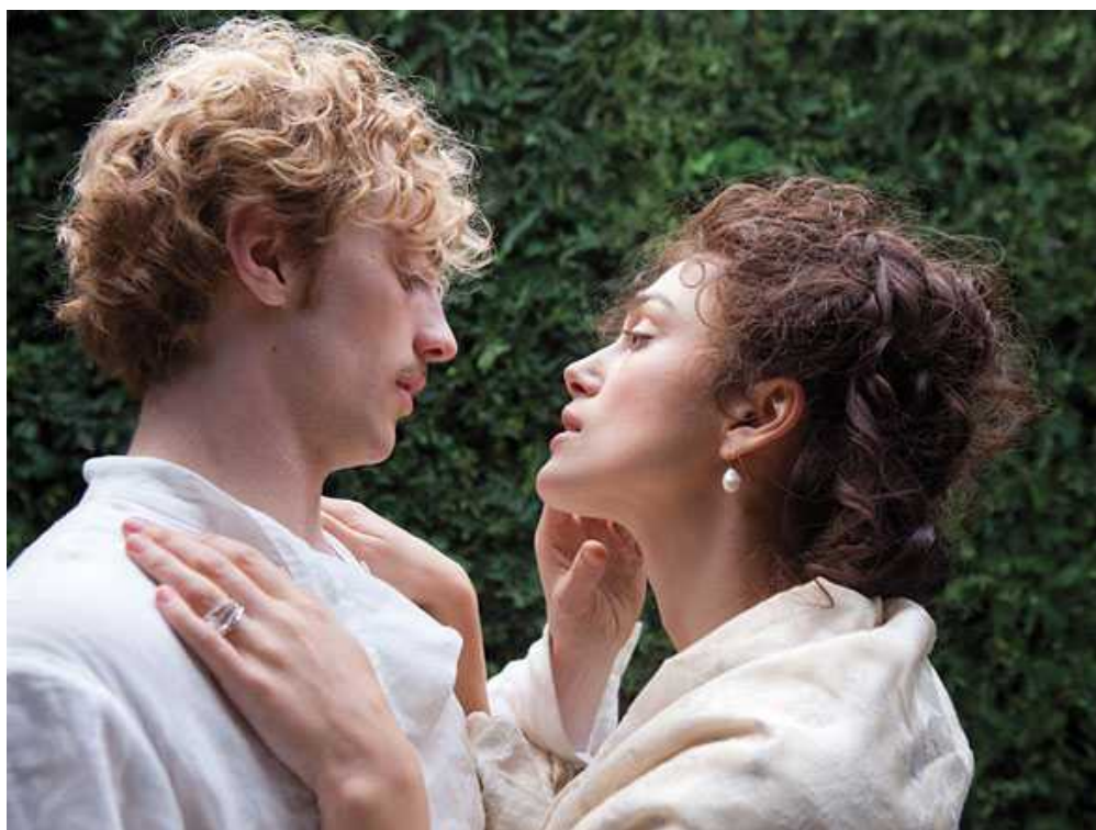
Вронский (Аарон Тэйлор-Джонсон) и Анна (Кира Найтли)

При этом зритель очарован игрой Киры Найтли, воплощающей Анну, которую убивает страсть: то трогательную и располагающую к себе, то невыносимую, капризную, нервную, съедаемую ревностью. С другой стороны Джуд Лоу – бородатый, постаревший и подурневший – талантливо влез в шкуру обманутого мужа, занудного и скованного Каренина, безумно страдающего, но предъявляющего своей жене ультиматум ради сохранения социального статуса.