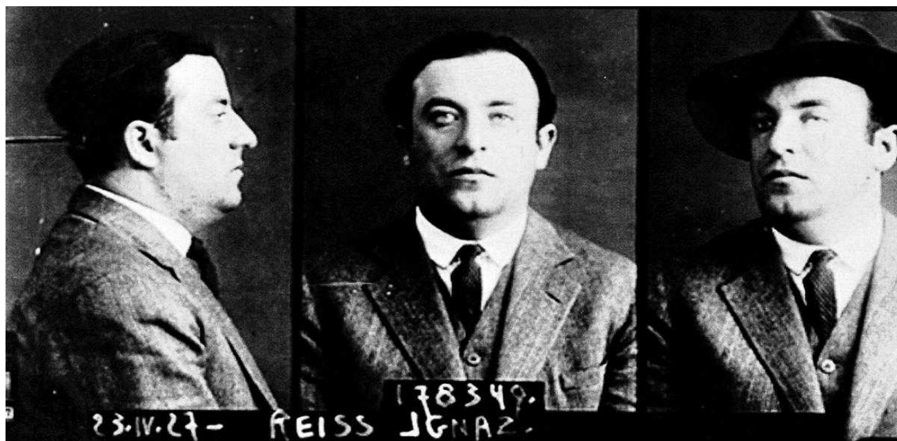
Полицейская фотография Игнатия Рейсса, сделанная в 1927 году

В 1920-22 годах Рейсс вновь работал во Львове, за распространение нелегальной литературы был арестован и приговорен к пяти годам тюрьмы, но бежал и перебрался в Германию. Остался в Западной Европе - выполнял поручения большевиков в Берлине, Амстердаме, Вене. В 1927 году получил задание создать разведывательную сеть в Великобритании. С 1931 года сотрудник ИНО ОГПУ - внешней разведки Советского государства. Он работал с такими легендарными разведчиками, как Рихард Зорге, Лев Маневич и Шандор Радо. Рейсс - человек умный, культурный, с хорошими манерами, использовал эти качества для вербовки для Советов агентов из числа профессоров, журналистов.