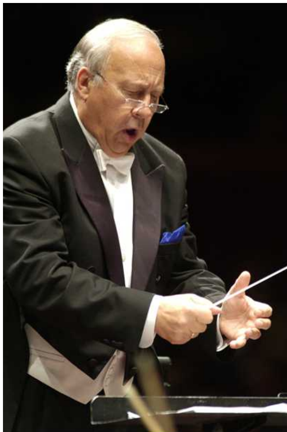
Neeme Järvi