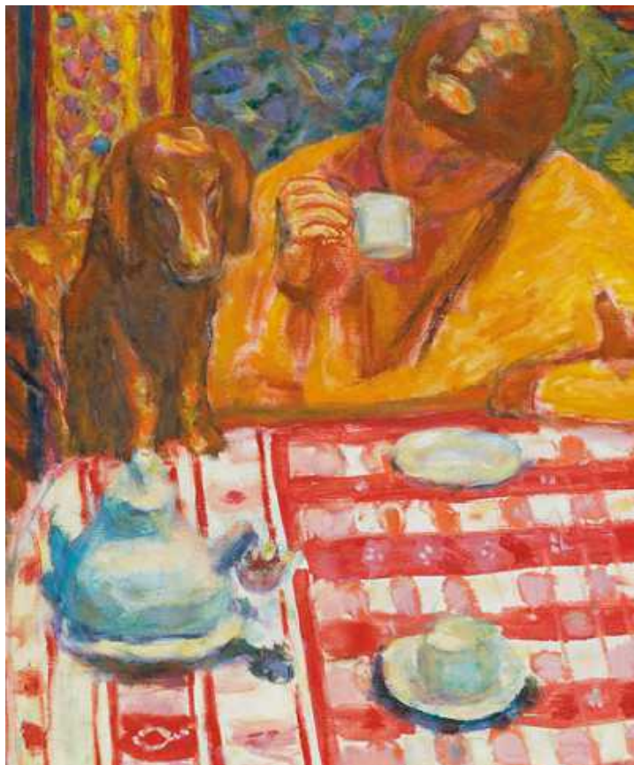
Кафе. Фрагмент. Пьер Боннар. 1915 Боннар и «Наби».

Довольно скоро Боннар перерос своих учителей и стал самостоятельным и признанным художником. В конце 1880-х он входит в состав художественно-артистической группы «Наби», основанной учеником Гогена французским художником Полем Серюзье (1864-1927). В ее состав входил и Феликс Валлотон, чьи работы выставлены на экспозиции в Лозанне в Fondation de l'Hermitage. Группа просуществовала только до 1905 года. Однако за этот короткий период художникам удалось выработать свой собственный легко узнаваемый стиль. Неважно, окажетесь ли вы в Пушкинском музее в Москве, в музее Орсе в Париже или в лондонской Тейт Модерн, вы безошибочно угадаете работы художников из «Наби». Название группы происходит от древнееврейского слова «нави», что значит «вестник», «пророк». Такое обозначение придумал поэт Анри Казалис, который углядел в группе художников-единомышленников черты, роднящие их с древними пророками народа израилева: «большинство носило бороды, некоторые были евреями, и все были до невозможности серьезны». Несмотря на такое описание, их работы отличается насыщенность яркими тонами и легкость, за которой скрывается философская концепция. Художники особенно увлекались религиозно-мистическими мотивами, с одной стороны, и интимно-лирическими сюжетами, с другой.