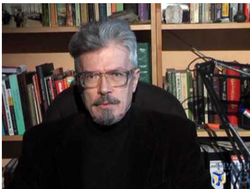
Эдуард Лимонов - герой книги Каррера

Как и Каррер, я тоже знакома с Лимоновым. Я раз или два встречалась с ним в Париже в 1980-х, а в последние годы виделась с ним в Москве. От наших парижских встреч у меня в памяти осталось лишь гладкое, какое-то детское лицо и вялое, влажное рукопожатие. В то время он был, в основном, известен своим скандальным романом «Это я, Эдичка», опубликованном во Франции под «звонким» названием «Русский поэт предпочитает больших негров». Я же работала в Интернационале Сопротивления, который занимался поддержкой диссидентов (многие из них оказались в Париже), и этот человек, который боготворил Сталина и участвовал в дебошах, на меня впечатления не произвел.