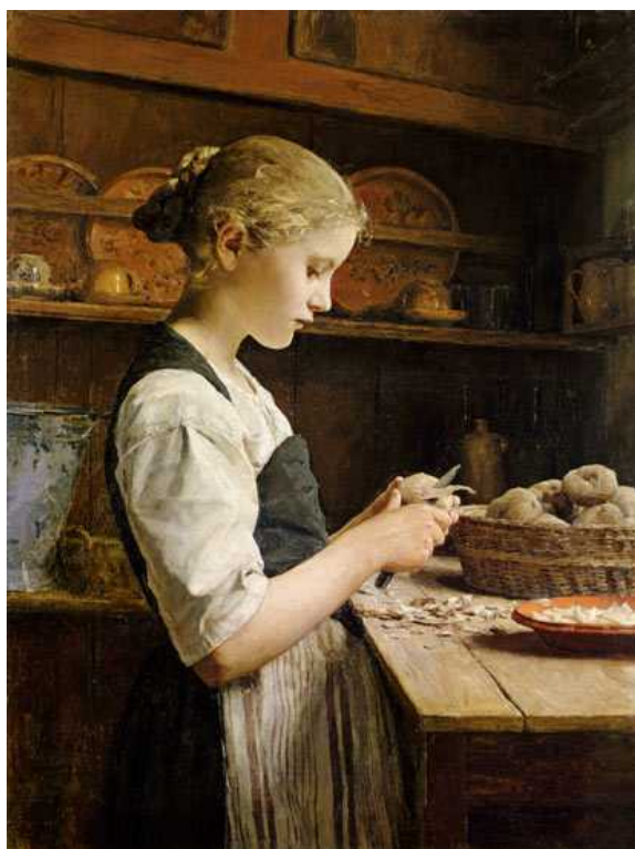
"Маленькая чистильщица картошки", 1886 г.

В 1866 году Альберт Анкер начал заниматься росписью фаянса для Теодора Дека, знаменитого французского фабриканта фаянса 19 века. За последующие годы появилось более 300 рисунков для фаянса Анкера. Он работал также в качестве иллюстратора для швейцарских художественных журналов.