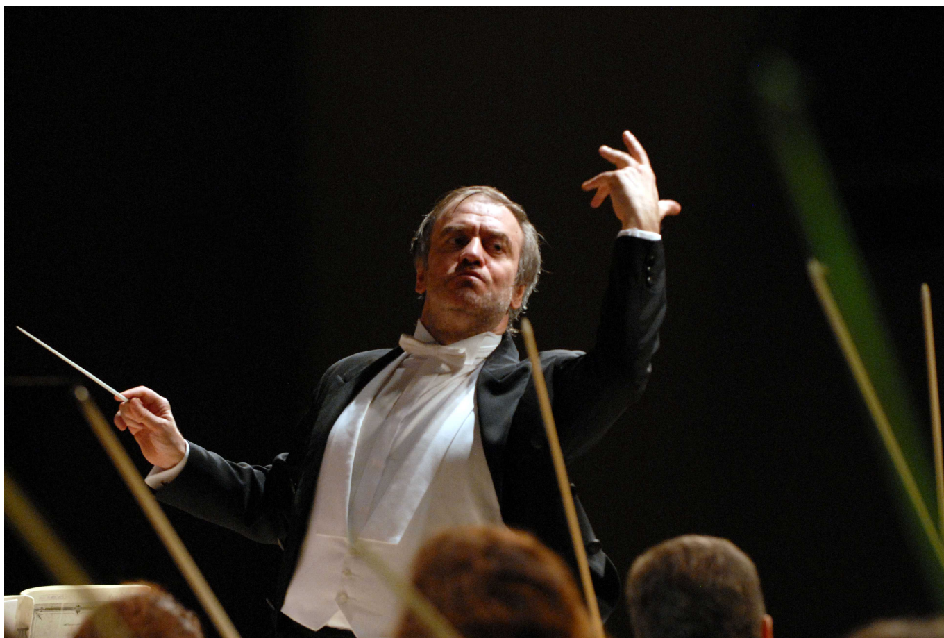
Маэстро Валерий Гергиев