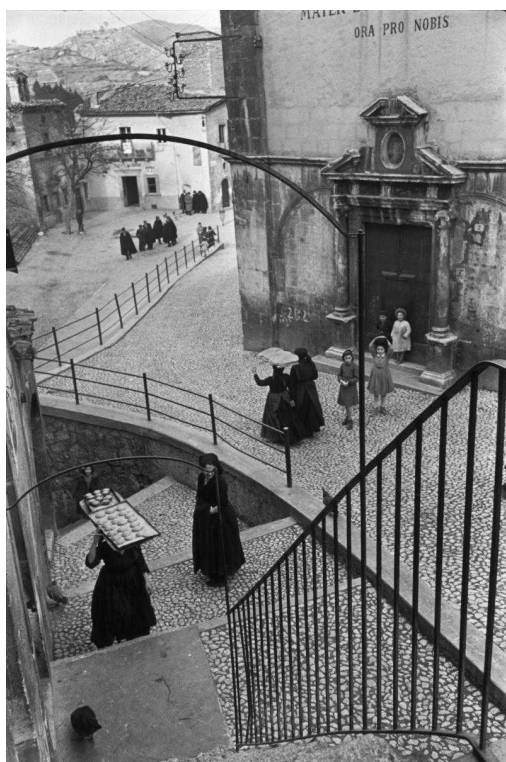
Аквила, регион Абруццо, Италия, 1951

Большая ретроспектива в Цюрихском музее дизайна приглашает последовать за взглядом одного из самых удивительных фотографов XX века и за объективом его Leica, фиксирующим «решающие моменты» жизнью и истории. От нищеты мексиканских кварталов в 30-х годах до репортажа о Швейцарии в 60-х, от индонезийских танцев и революций в Азии до поездки по ту сторону Железного занавеса, - мгновения пойманной и остановленной реальности переплетаются с путями странствующего по миру фотографа.