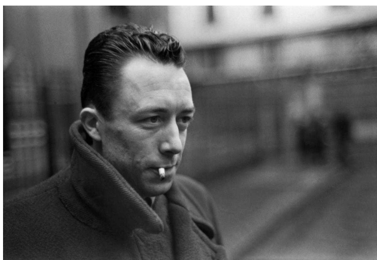
Портрет Альбера Камю, Париж, 1944

В 1940 году Анри Картье-Брессон, к тому времени уже известный фотограф, попадает в плен к немцам. После двух неудачных попыток побега, третья завершается успехом в 1943 году. Фотограф воссоединяется со своим неизменным спутником, Leica, откопав его в Вогезах, где предварительно спрятал. Во время войны он участвует в движении Сопротивления, помогает пленным и бежавшим из лагерей, одновременно снимая оккупированную, а затем освобождаемую Францию. В этот же период Картье-Брессон создает портреты известных художников и писателей для издательства Braun: Матисса, Пикассо, Брака, Боннара, Клоделя.