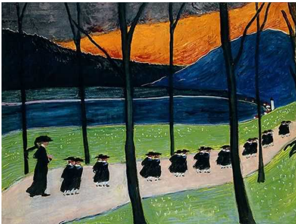
Марианна Веревкина. Осень (Школа), 1907

Author: Надежда Сикорская, Москва , 07.09.2010.