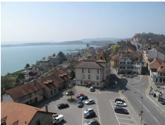
Вид на Грансон с замка: на горизонте - церковь Св. Иоанна Крестителя

Все дороги Грансона ведут к замку, но, проходя по ним, стоит внимательно смотреть по сторонам, чтобы не пропустить исторические сокровища городка. Обязательно загляните в средневековую церковь Святого Иоанна Крестителя - редкий памятник романской архитектуры XII века, с необыкновенными капителями и расписными орнаментами колонн и сводов. Монастырская церковь сначала принадлежала овернскому аббатству La Chaise-Dieu, но к XIII веку обнищала. Благодаря ренте Отона Первого - того самого, что построил замок Грансон, в церковь вернулись монахи, прихожане и жизнь. Гробница Отона, бывшего очень религиозным человеком, находится в Лозаннском соборе.