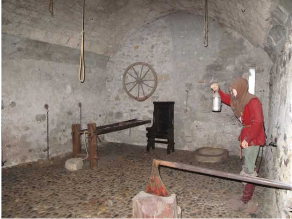
Зал пыток

12 августа 1476 года кантоны Берн и Фрибург заключили соглашение о совместном управлении Грансоном. До XVIII века в крепости сменялись бернские и фрибургские управляющие, пока в XIX веке она не отошла к кантону Во. Некоторое время замок использовался в качестве тюрьмы: Зал правосудия, где проходили допросы, сейчас тоже можно посетить. Еще он называется «Залом пыток», так как здесь выставлены устрашающие орудия, использующиеся для далеко не самых гуманных казней прошлых веков, - «колесо» для пыток и топор.