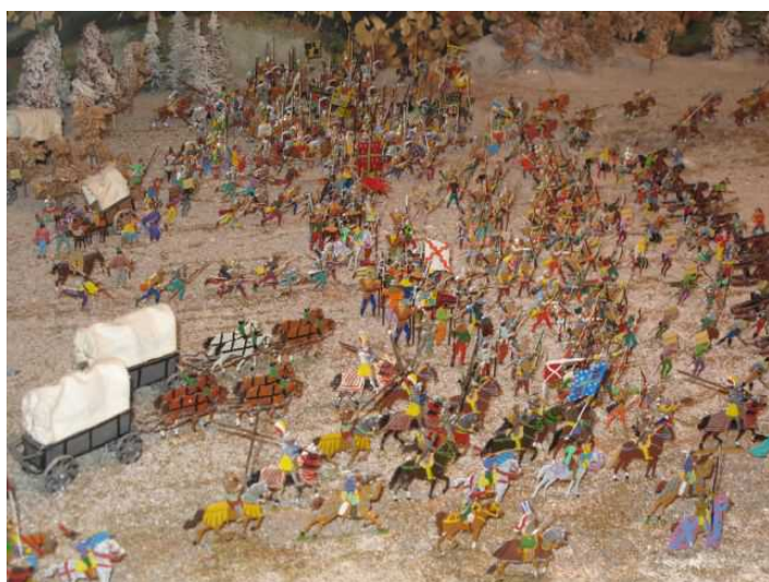
Битва при Грансоне: макет в замке

Конфедерация собрала войско из 18 000 человек и отправилась на Грансон, где раскинулся лагерь Карла Смелого (до сих пор в так называемом Оружейном зале замка хранятся экспонаты времен Бургундских войн и главная достопримечательность – шатер Карла, восстановленный в деталях по бернской летописи Диепольда Шиллинга).