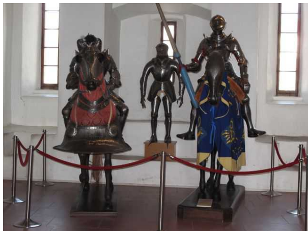
Рыцари Грансона

Однако на Грансон, как и на другие земли, некогда принадлежавшие Савойскому графству, претендовал серьезный соперник – молодая Швейцарская Конфедерация, к тому времени прославившаяся своими воинскими доблестями и, к тому же, успевшая заручиться поддержкой французского короля Людовика XI и императора Фридриха III, недовольных завоевательной политикой Бургундии и Савойи в Европе. В 1475 году войска Берна завладели Грансоном, но уже через год Карл Смелый, бургундский герцог, мечтавший завоевать пол-Европы, решил вернуть принадлежавший ему город. Перед его артиллерией швейцарский гарнизон не устоял и добровольно сдался. Но разгневанный герцог решил наказать посягнувших на его владения швейцарцев и казнил 412 солдат гарнизона. Такая жестокость возмутила Берн и его союзников.